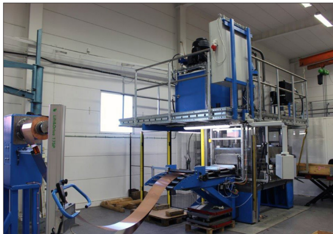
Nu är plattvärmväxlartillverkaren Airecs nyinvestering – en hel presslinje från SMV Industrier – på plats i Malmö. Hydraulpressen har en presskraft på 600 ton.